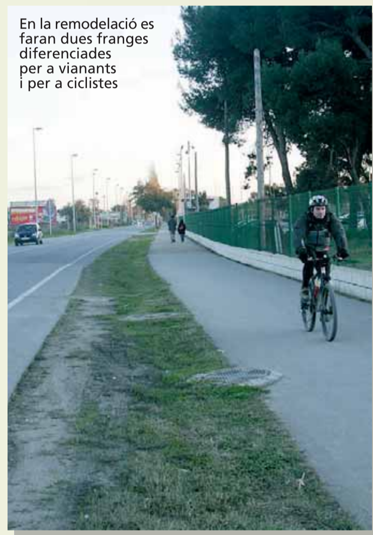
En la remodelació es faran dues franges diferenciades per a vianants i per a ciclistes