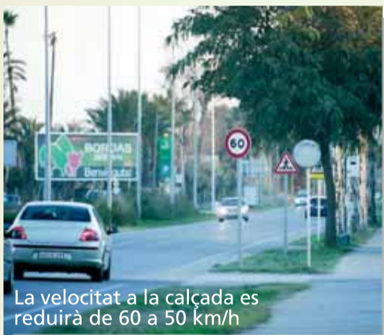
La velocitat a la calçada es reduirà de 60 a 50 km/h